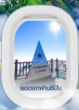
ยอดเขาฟานซิปิน

✈️ คอนเฟิร์มออกเดินทาง ✈️ ทุกพีเรียด 2 ท่านขึ้นไป