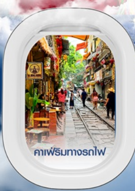
คาเฟ่ริมทางรถไฟ