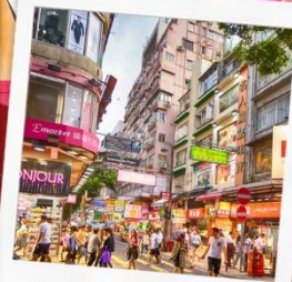
ช้อปปิ้งย่านมงก๊ก