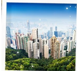
จุดชมวิวกาวิกตอเรีย