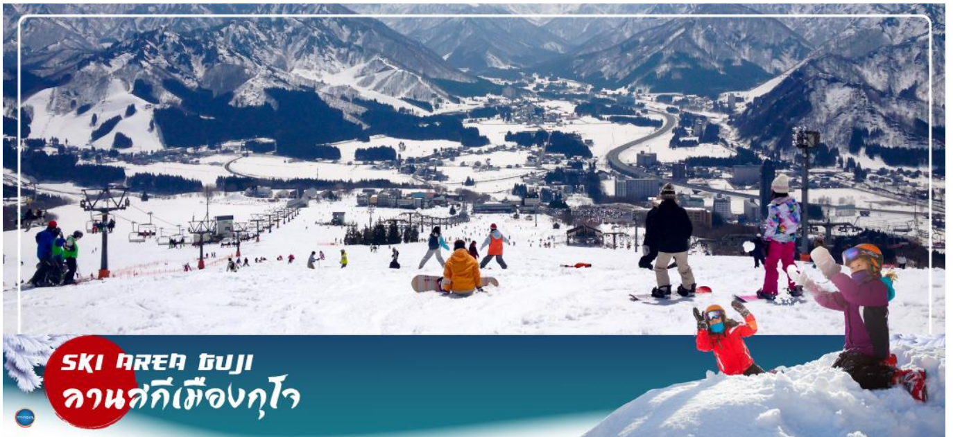
SKI AREA GUJI ลานสกีเมืองกุโจ

วันที่สาม เมืองกุโจซาจิมัง – ลานสกีเมืองกุโจ – เมืองกิฟู – หมู่บ้านมรดกโลกชิราคาวาโกะ – เมืองทาคายามะ – ถนนชั้นมาจิซุจิ – เมืองนาโกย่า