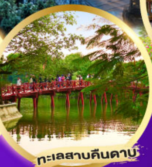
ทะเลสาบคินคาบ