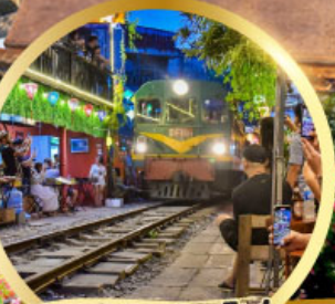
ร้านกาแฟฟรอกโฟ