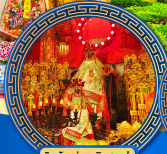
วัดเจ้าแม่กวนอิมสองห้า