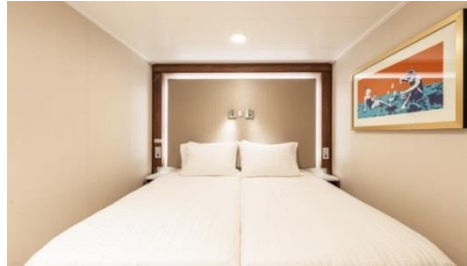
พัก 1-2 ท่าน

From 13 - 14 sq.m Max Occupancy 2-4^ Deck 5/8/9/10/11/12/13/15 2 Single Beds / 2 Single Beds + 1 Ceiling Pullman Bed / 1 Single Bed + 1 Pullman Bed + 1 Double Sofa Bed