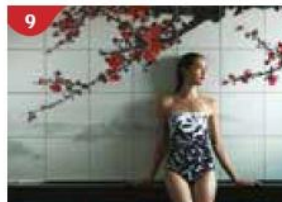
9 Crystal Life™ Spa Rejuvenate mind, body and soul with our holistic Western and Asian spa experience.