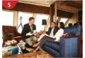
5 The Palace Indulge in European-style butler service and exclusive facilities.