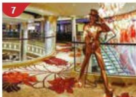
7 Johnnie Walker House™ Immerse yourself in the intricate world of premium Scotch whisky.