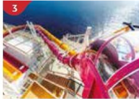
3 Waterslide Park Get drenched in fun on one of our six different waterslides.