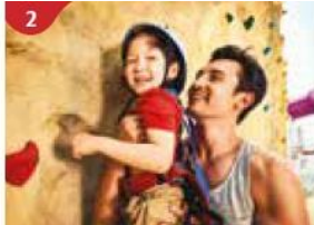
2 Rock Climbing Wall Challenge yourself on our mountainous rock climbing wall.