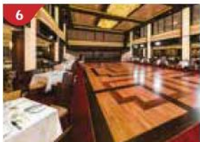
6 Dream Dining Room Savour a wide variety of Asian and international cuisine.