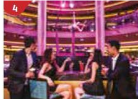
4 Bar 360 Catch live music and aerial acrobatic performances with a glass of champagne.