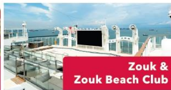
Zouk & Zouk Beach Club