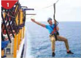
1 Ropes Course & Zipline Feel the thrill of gliding above the ocean on a 35-metre zipline.

ถ้าท่านประสงค์จะถือกระเป๋าเดินทางลงด้วยตัวเองไม่จำเป็นต้องวางไว้ที่หน้าห้องพัก