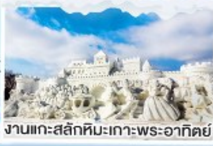
งานแกะสลักหิมะเกาะพระอาทิตย์