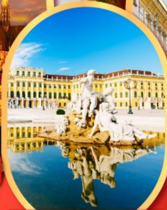
พระราชวังซินบรูนน์