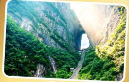
เขาเทียนเหมินซาน

ทริปเดียวเที่ยว 2 เมืองโบราณ ฝูหรงและเฟิ่งหวง