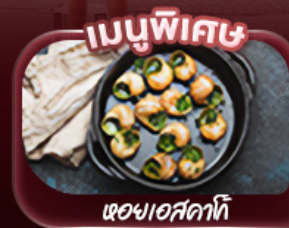
หอยแอสคาทิ