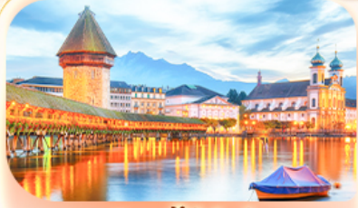
สะพานไมซ์าเปค