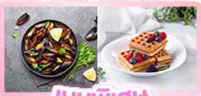
เมนูพิเศษ หอยมัสเซล+วาฟเฟิล