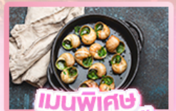
เมนูพิเศษ หอยเอสคาโท