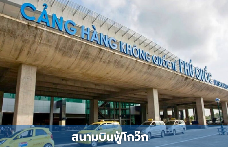
สนามบินฟู้โก๊วก