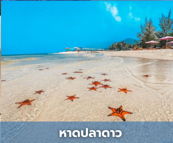
หาดปลาตา