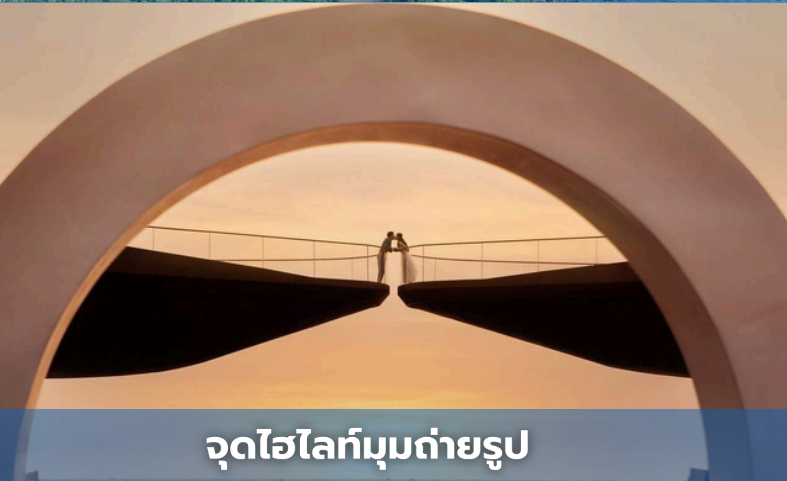
จุดไฮไลท์มุมถ่ายรูป