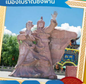
เมืองโบราณซงพาน