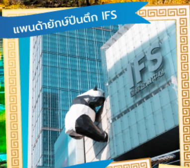
แพนด้ายักษ์ปิ่นตึก IFS