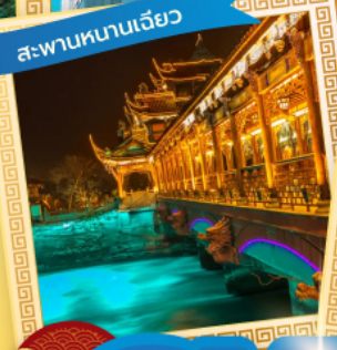
สะพานหนานเฉียว