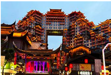
ตึกมหิศวรรษย์ 72 ชั้น

พักที่ CHANGDE YUNXI HOTEL ระดับ 4 ดาวท้องถิ่น หรือเทียบเท่าในเมืองฉางเต๋อ