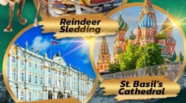
St. Basil's Cathedral