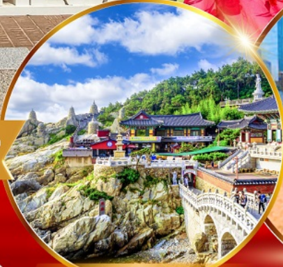
วัดแสงยงกุงซา