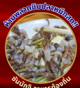
ห้ามพลาดชิมปลาหมึกสด!

โพฮังสเปซวอล์ก สกายวอร์ค ตามรอยซีรีส์ Hometown chachacha ถ่ายรูปชิคๆ หมู่บ้านวัฒนธรรมคิมซอน ขึ้นเคเบิลคาร์ ชมทะเลปูซาน นั่งรถไฟปู๊กบีก sky capsule ชิมของอร่อยตลาดแฮუნแด อิสระช้อปปิ้ง Lotte Duty Free