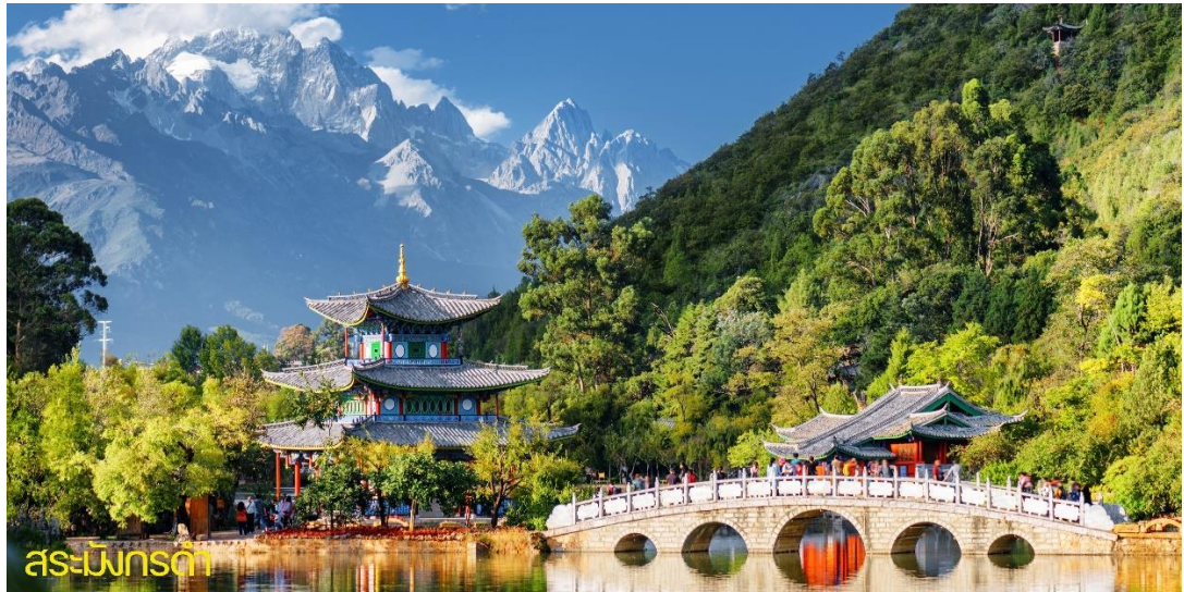
สระเมิงกรดา

นำท่านเดินทางสู่ เมืองโบราณลี่เจียง”ชมชีวิตความเป็นอยู่แบบโบราณที่ยังคงหลงเหลือให้ได้พบเห็นในเมืองนี้ภายในเมืองโบราณมีร้านของฝากของที่ระลึกมากมายและเมืองนี้ได้รับประกาศจากองค์การยูเนสโกให้เป็น “เมืองมรดกโลก”