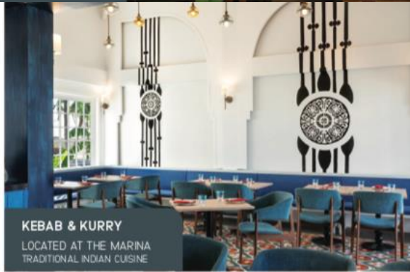
KEBAB & KURRY LOCATED AT THE MARINA TRADITIONAL INDIAN CUISINE