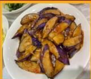
มะเขืออบหม้อดิน