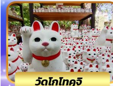
วัดโทโทคุจิ