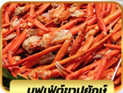
บุฟเฟ่ต์ขาปูยักษ์