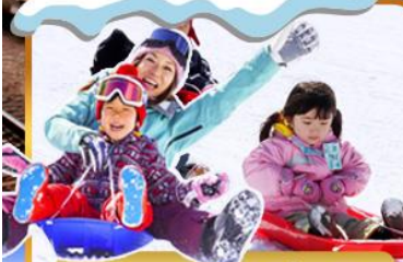
กิจกรรมภาคเลื่อนหิมะ