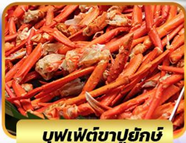
บุฟเฟ่ต์ขาปูยักษ์

ฟรีเดย์โตเกียว 1 วัน อิสระ ช้อปปิ้งหรือช้อปปิ้งทัวร์เสริมดั่งสนีย์แลนด์ 27 ธ.ค. - 01 ม.ค. 2568