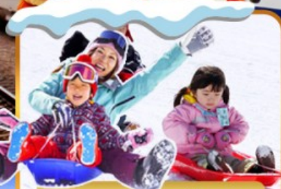
กิจกรรมภาคเลื่อนหิมะ