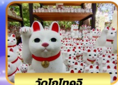
วัดโกโทจิ