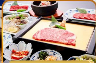
บียง่างร้านดัง ROKKASEN