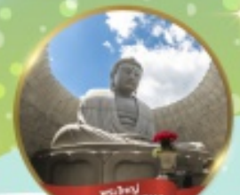
พระไฟหญ HILL OF BUDDHA