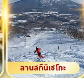
ลานสกีนิเซโกะ