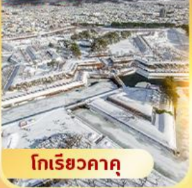
โทเรียวกาคู