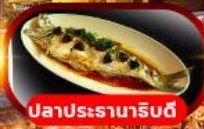
ปลาประจานาริบดี