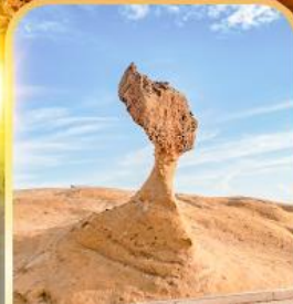
อุทยานเหยี่ยวหลิว