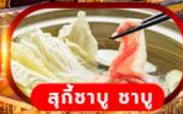
สุกี้ซาบู่ ซาบู