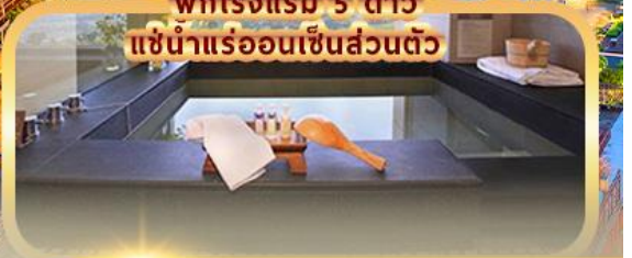
พักโรงแรม 5 ดาว แช่น้ำแร่ร้อนเซ็นส่วนตัว