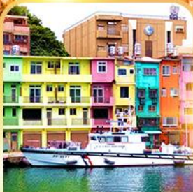
ตึกหลากสีท่าเรือเจินปิง