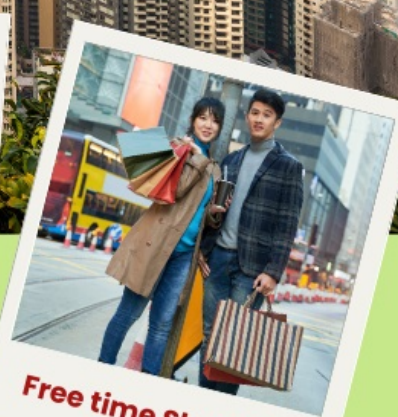
Free time Shopping