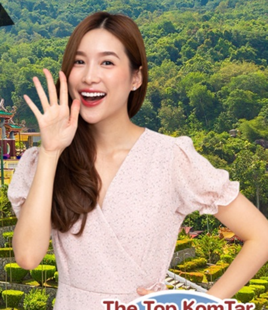
The Top KomTar