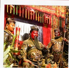
เทพเจ้ากวนอู วัดถวนโถ