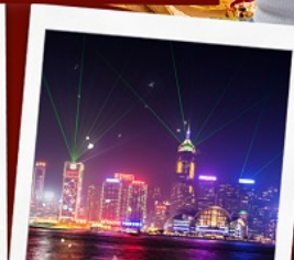
ชมโชว์ SYMPHONY OF LIGHT