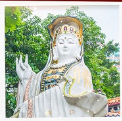
เจ้าแม่กวนอิมรัพลัสเบย์