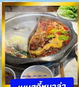
เมนูสุกที่หม้อล่า