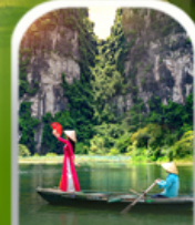
ล่องเรือตามก๊ก (ฮาลองบ๊ก)

เที่ยว 4 วัน 3 คืน เดินทาง กันยายน - ธันวาคม 67