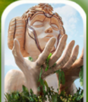
โมอาน่า คาเฟ่