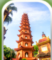
เจดีย์เงินทิว