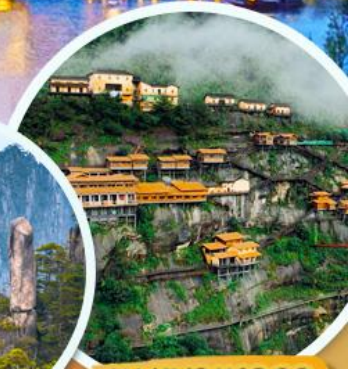
หุบเขาเทวดา

เมนูพิเศษ!! เปิดปักกิ่ง หมูแดง ปลาหมักเป็ยร้อฮยาง