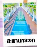
สะพานกระจก