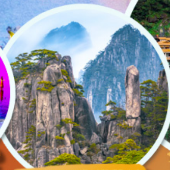
ภูเขาหวงชาน