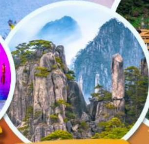
ภูเขาหลวงซาน