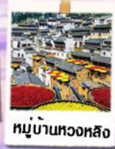
หมู่บ้านหวงหลิง