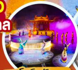
ชมโชว์อั้งการ