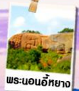
พระนอนอียาง