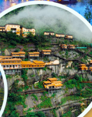
ชมเขาเทวดา