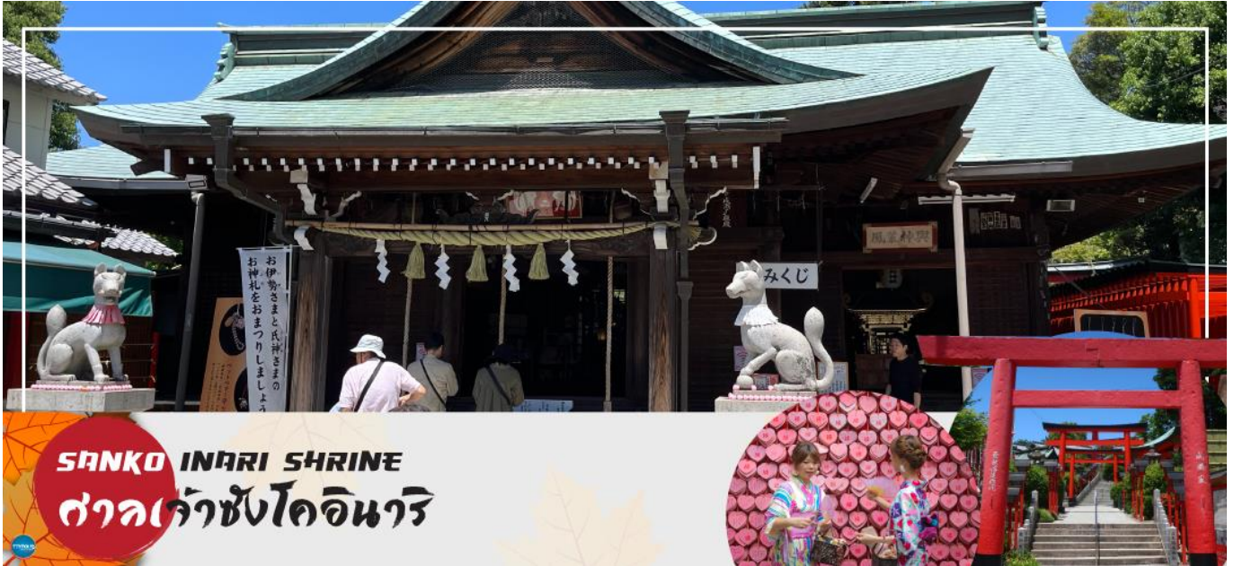
SANKO INARI SHRINE ศาลเจ้าซังโคอินาริ

จากนั้นนำท่านเดินทางสู่ ศาลเจ้าซังโคอินาริ (Sanko Inari Shrine) ตั้งอยู่ใกล้ๆ กับปราสาทอินุยามะ ศาลเจ้านี้มีชื่อเสียงเรื่องความรัก คู่รักมักจะมาขอพรให้มีความสัมพันธ์ที่ดี ชีวิตคู่ราบรื่น ครองรักกันยาวนาน ส่วนคนโสดก็จะขอให้ได้พบเจอคู่แท้จุดเด่นคือเสาโทริอิสีแดงที่เรียงรายสวยงาม และแผ่นป้ายขอพรรูปหัวใจสีชมพู ที่นี้ยังช่วยเรื่องการเงินอีกด้วย ว่ากันว่าถ้านำเงินมาล้างที่บ่อน้ำศักดิ์สิทธิ์ภายในศาลเจ้า จะช่วยให้เงินนั้นงอกเงยขึ้นหลายเท่า ครอบครัวเจริญรุ่งเรือง