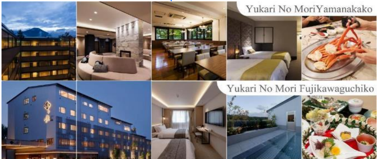
Yukari No Mori Yamanakako