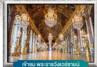
เข้าชม พระราชวังแวร์ซายน์