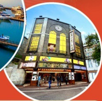
ร้าน POP MART ใหญ่ที่สุดในไต้หวัน