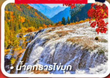
น้ำตกธารโง่บูก