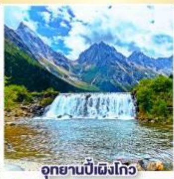
อุทยานปี้เผิงโกว