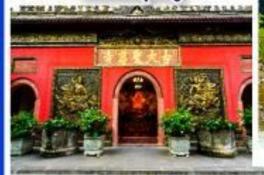
วัดต้าเจี๊ว