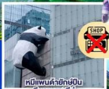
หมีแพนด้ายักษ์ปิ่น ตึกถนนชุนซีอู่