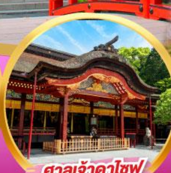
ศาลเจ้าดาไซฟุ