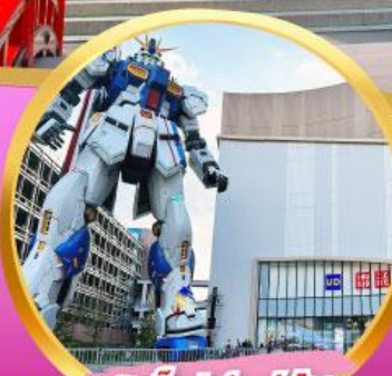
กันดั้ม ปาร์ค ฟุกุโอกะ