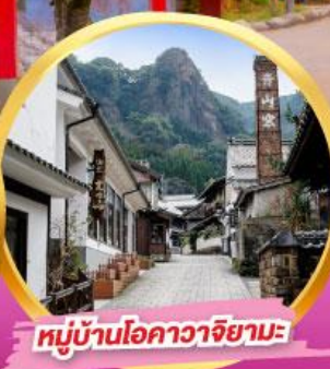
หมู่บ้านโอคาวาจิยามะ