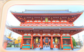
วัดฮาซากุสะ