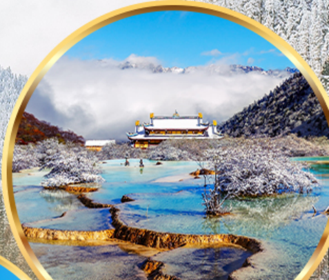
อุทยานหวงหลง