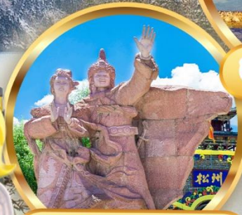
เมืองโบราณซงพาน