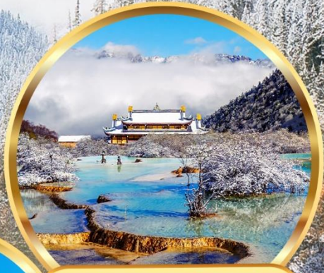
อุทยานหวงหลง