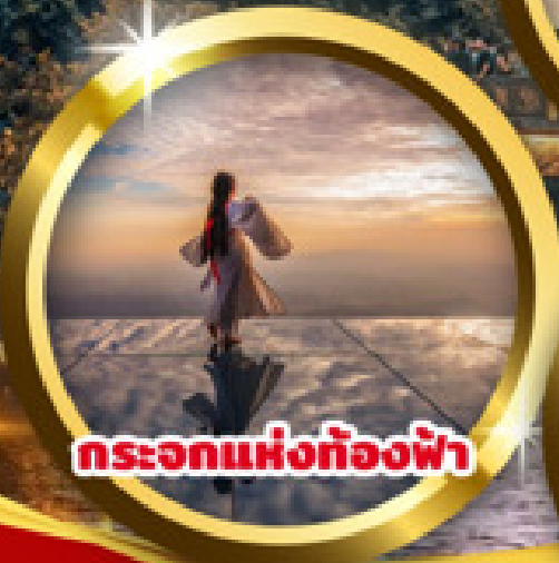
กระเอกแห่งท้องฟ้า