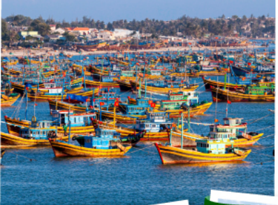
หมู่บ้านชาวประมงมุยเน่