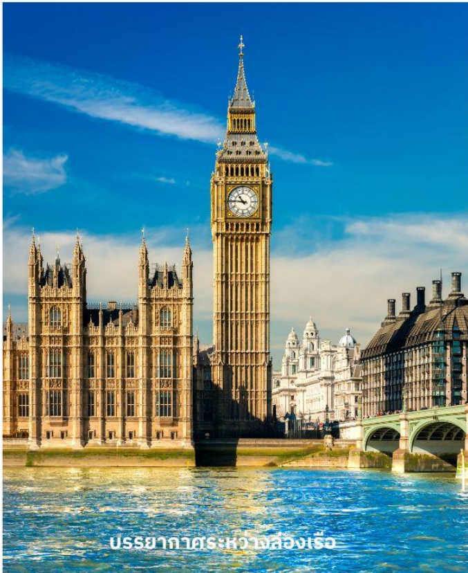
บรรยากาศระหว่างล่องเรือ

จากนั้นผ่านชมสถานที่สำคัญต่างๆ อาทิ บ้านเลขที่ 10, ถนนดาวนิงนี้่งทำเนียบนายกรัฐมนตรี, จัตุรัสทราฟัลการ์, อนุสรณ์แห่งสงครามทราฟัลการ์ของท่านลอร์ดแนลสัน, พิคคาเดิลลี เซอร์คัส, ย่านโซโฮ ฯลฯ