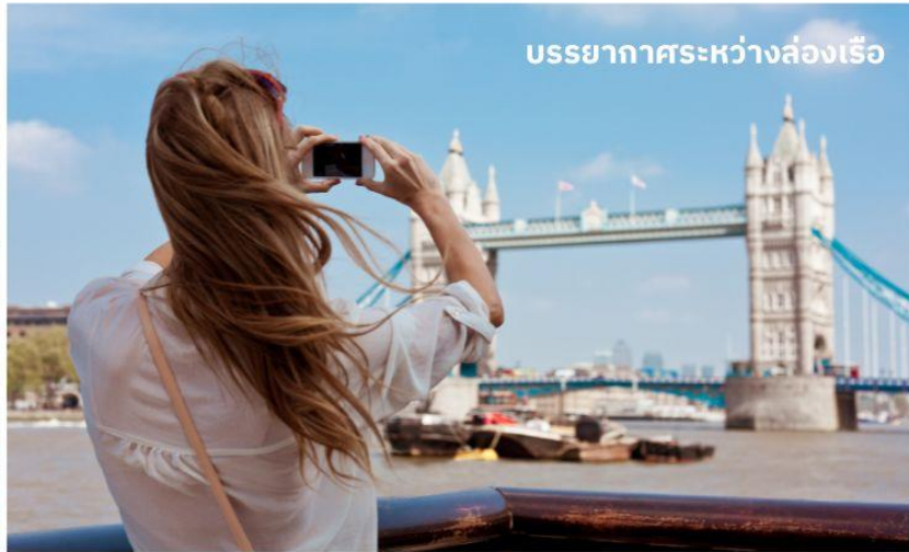
บรรยากาศระหว่างล่องเรือ

ชมทิวทัศน์งดงามของสองฝากฝั่งแม่น้ำเทมส์ ซึ่งไหลผ่านกลางกรุงลอนดอน ล่องเรือผ่านสถานที่สำคัญต่างๆ เช่น จัตุรัสรัฐสภา, พระราชวังเวสต์มินสเตอร์, ลอนดอนอาย, ทาวเวอร์ออฟลอนดอน และ ทาวเวอร์บริดจ์