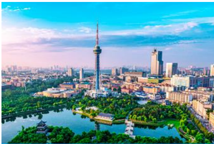
เมืองจี่หลิน

23.30 น. คณะพร้อมกัน ณ ท่าอากาศยานสุวรรณภูมิ อาคารผู้โดยสารระหว่างประเทศขาออกอาคาร ชั้น 4 ประตู 10 เคาน์เตอร์สายการบิน SHENZHEN AIRLINES พบเจ้าหน้าที่บริษัทฯ คอยให้การต้อนรับและอำนวยความสะดวกด้านเอกสารและสัมภาระก่อนการเดินทาง