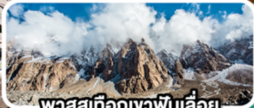
พาสสุเทือกเขาพินเลื่อย

เดินทาง 08-16 ก.พ. 68 (วันวาเลนไทน์, วันมาฆบูชา)