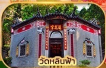
วัดหลินฟา