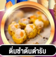
ติ่มซำต้นตำรับ