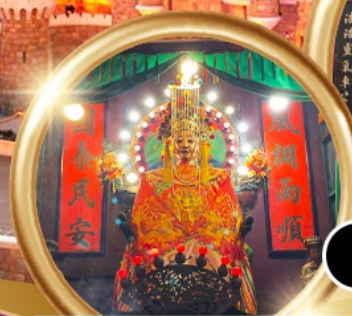
ขอพรซื้อขายอสังหาริมทรัพย์