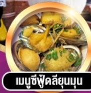
เมมูซึฟู้ดลึยมูนูน