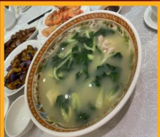
ซุปรังไก่หมู