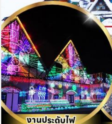
งานประดับไฟ Tokyo german village