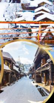
ทาคายาม่า