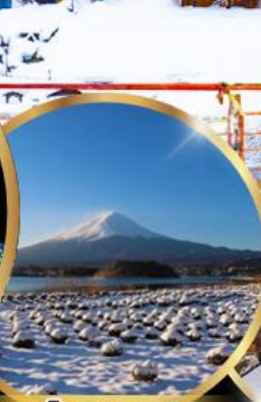
สวนโออิชิ พาร์ค