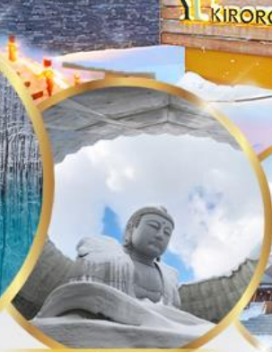
เป็นเขาแห่งพระพุทธเจ้า