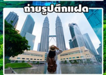
ถ่ายรูปตึกแฝด